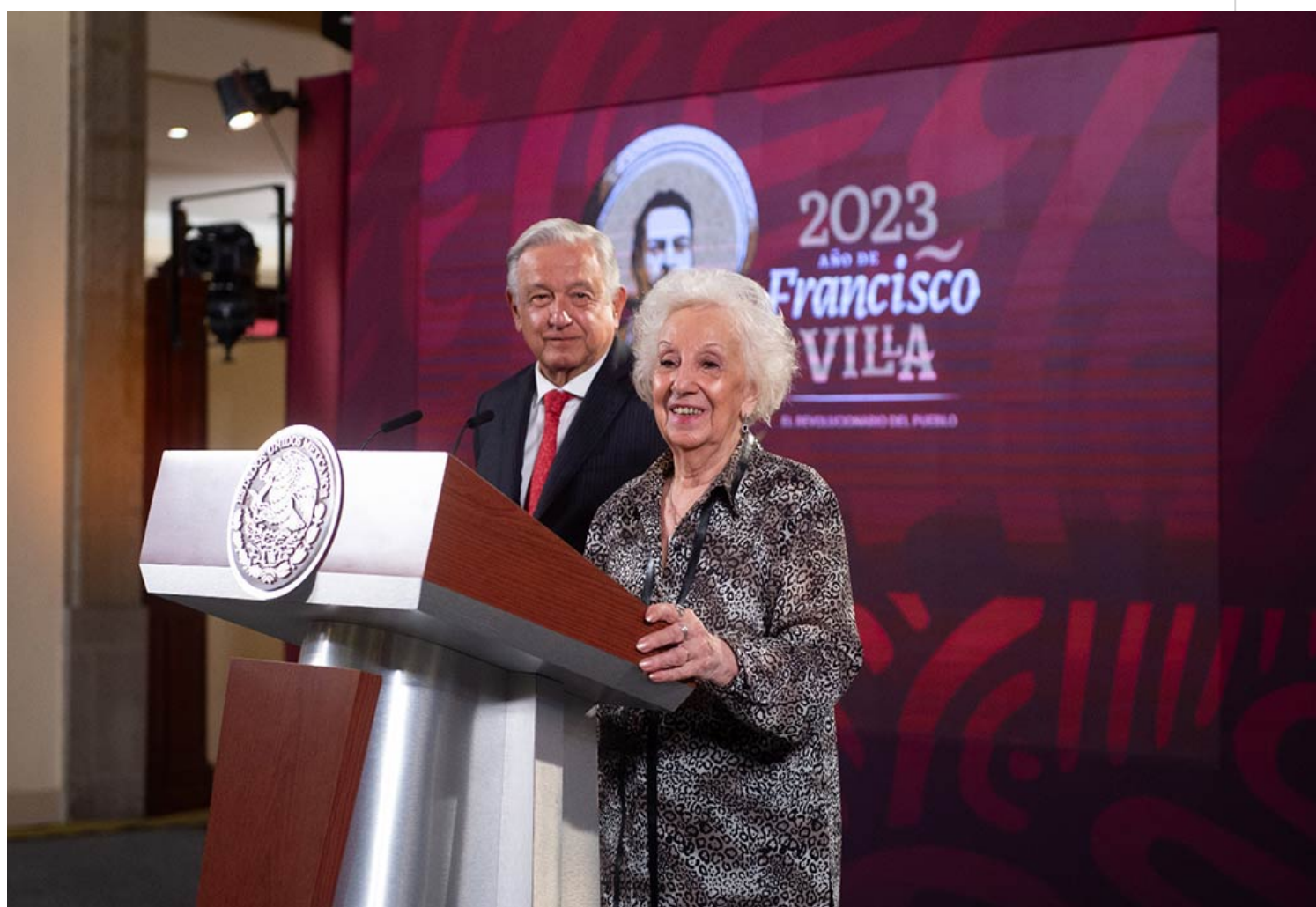
Presidenta de las Abuelas de Plaza de Mayo, Estela de Carlotto en la mañanera de López Obrador.

Ciudad de México, 21 jul (RHC) El presidente de México, Andrés Manuel López Obrador, acogió este viernes en su conferencia de prensa matutina en el Palacio Nacional, a la fundadora y presidenta de las