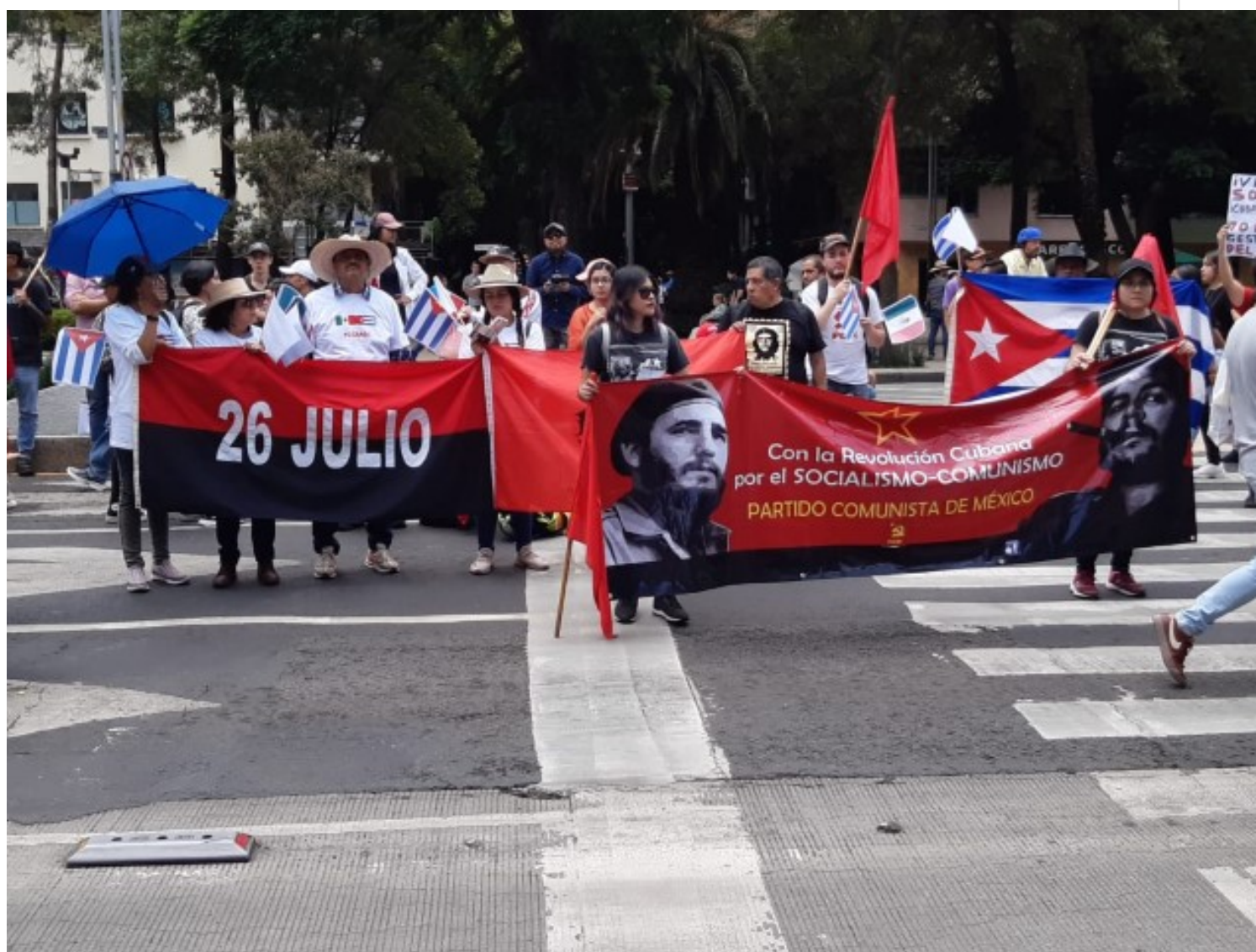
Conmemoran en México el 70 aniversario del Moncada.