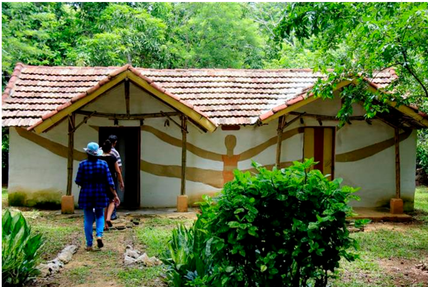
Finca agroturística y ecológica La Picadora, en la comunidad rural de igual nombre.

Sancti Spíritus, 25 jul (PL) A orillas de la carretera, en el municipio de Yaguajay, se alza hoy la comunidad rural La Picadora y en ella la finca agroturística y ecológica de igual nombre, atractivo sitio en esta provincia de Cuba.