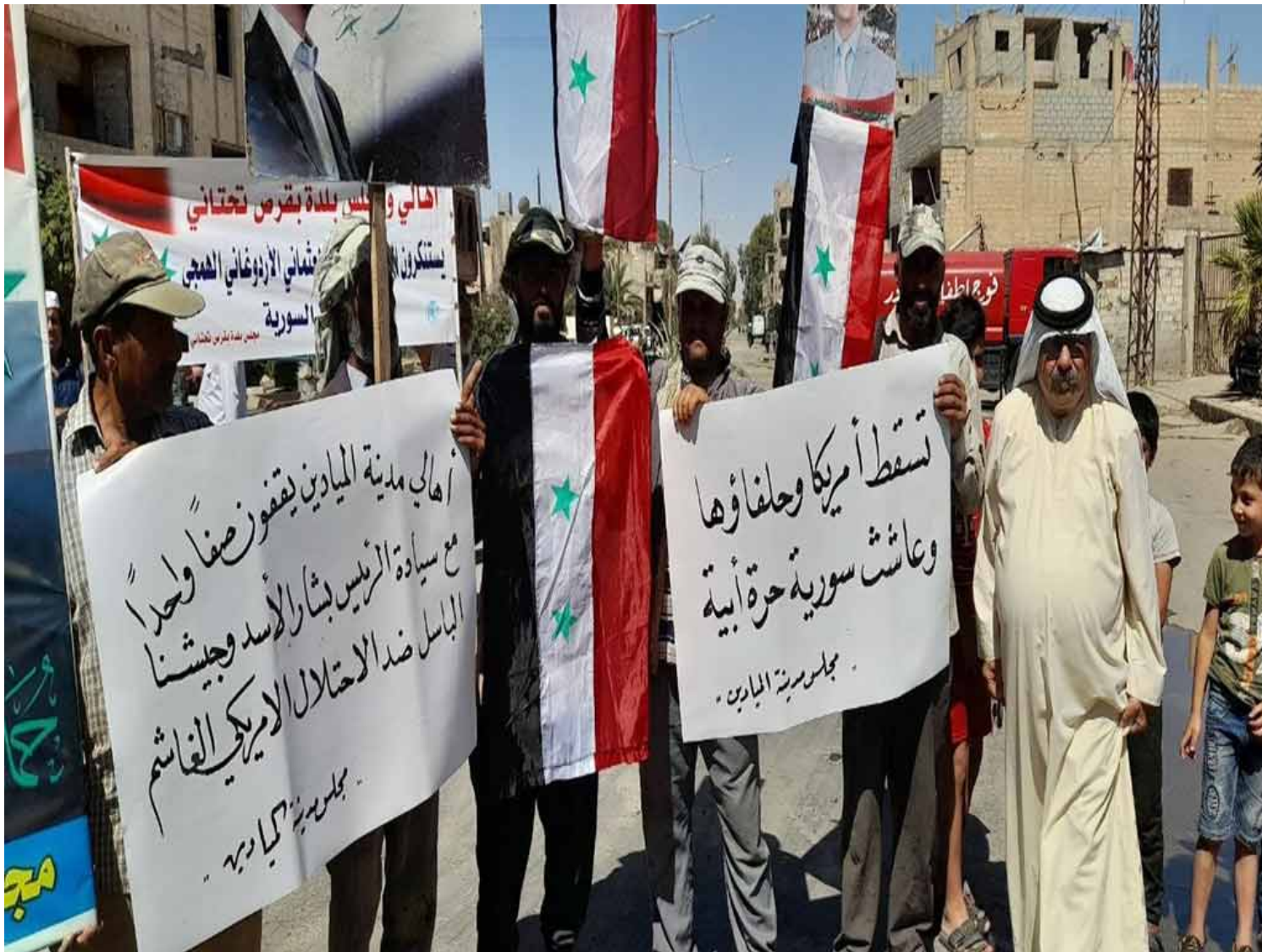
Pancartas y consignas contra el ocupante -EEUU- y sus milicias mercenarias.