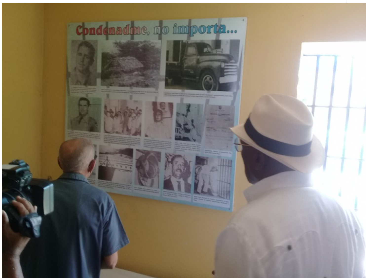
Valdés Mesa recorre sitios históricos en Santiago de Cuba vinculados con los sucesos del 26 de julio.