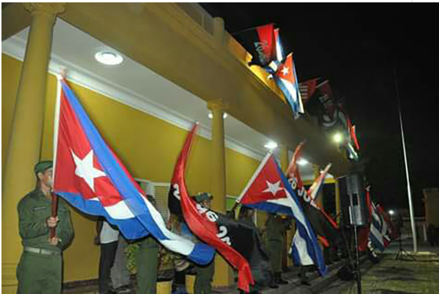
Acto patriótico para recordar el asalto al cuartel Carlos Manuel de Céspedes, hace 70 años.

Bayamo, 26 jul (RHC) Jóvenes de la provincia cubana de Granma protagonizaron este miércoles el tradicional asalto simbólico al otrora cuartel Carlos Manuel de Céspedes, de esta ciudad oriental, para recordar la hazaña ocurrida aquí hace 70 años, en igual fecha, pero de 1953.