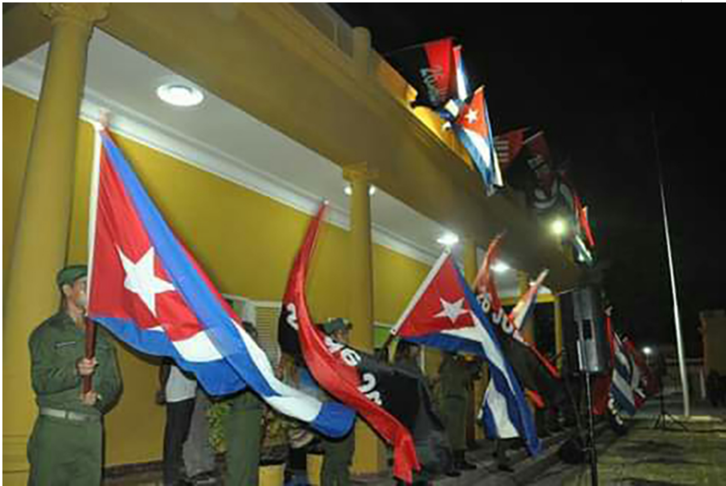
Acto patriótico para recordar el asalto al cuartel Carlos Manuel de Céspedes, hace 70 años.

Bayamo, 26 jul (RHC) Jóvenes de la provincia cubana de Granma protagonizaron este miércoles el tradicional asalto simbólico al otrora cuartel Carlos Manuel de Céspedes, de esta ciudad oriental, para recordar la hazaña ocurrida aquí hace 70 años, en igual fecha, pero de 1953.