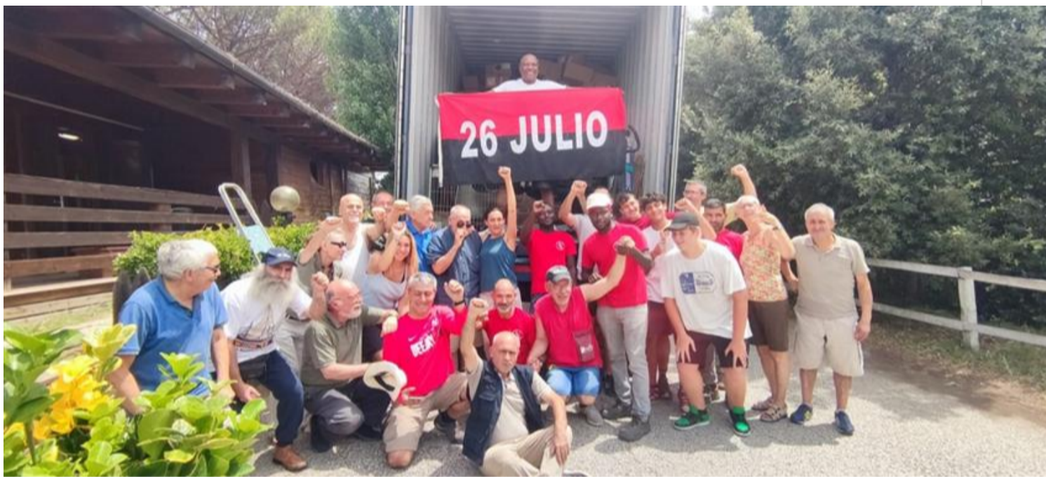
Integrantes de la asociación italiana La Villetta.

Roma, 27 jul (RHC) La Villetta, asociación de solidaridad con Cuba, envió desde Italia un cargamento de ayuda al pueblo de ese país en la fecha histórica del 26 de julio, informó este jueves un vocero de la organización.