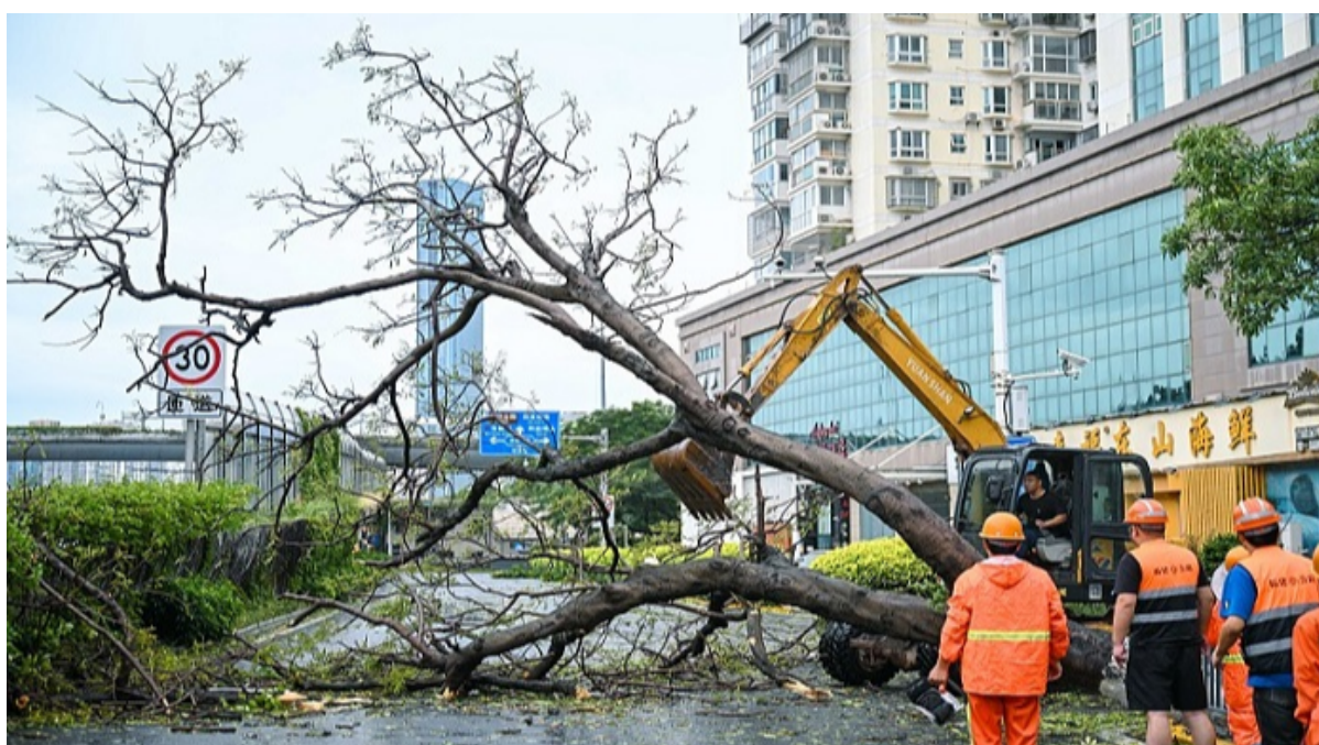
Algunos daños ocasionados por el fenómeno hidrometeorológico en la capital china.

La Habana, 2 ago (RHC) El ministro de Relaciones Exteriores de Cuba, Bruno Rodríguez envió este miércoles un mensaje de solidaridad y el sentido pesar a los pueblos y Gobiernos de China y Filipinas por los estragos ocasionados por el tifón Doksuri.