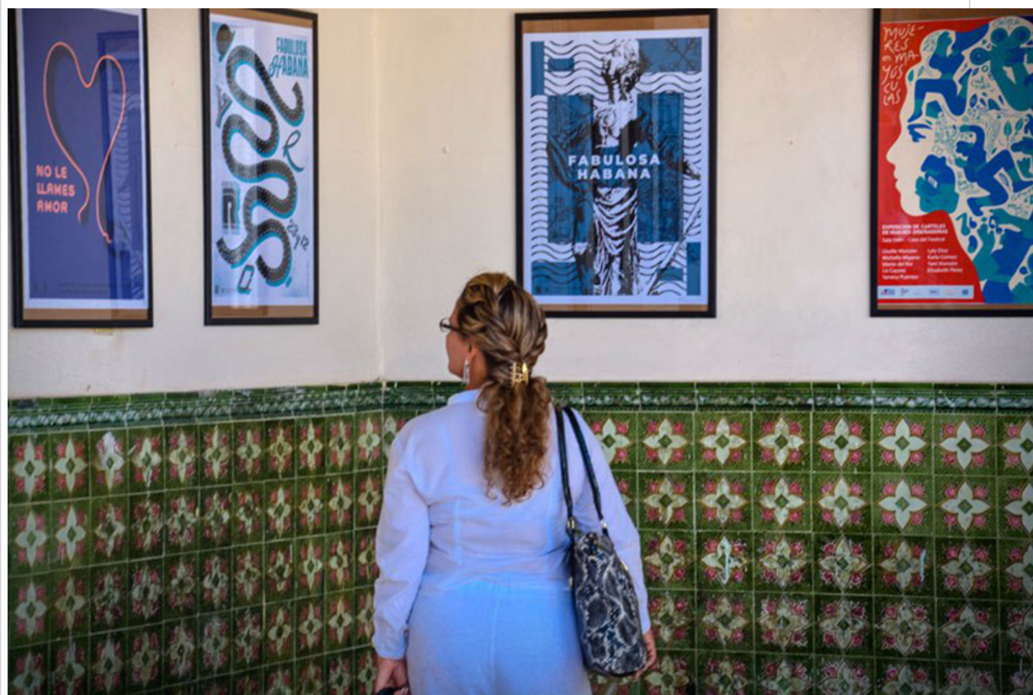
Exposición de mujeres diseñadoras, en el Festival Internacional de Cine de Gibara.

Holguín, 5 ago (ACN) La exposición “Mujeres diseñadoras”, perteneciente al proyecto CartelOn, muestra el desarrollo del diseño serigráfico en Cuba y la inserción del género femenino en esta manifestación artística como parte de la edición XVII Festival Internacional de Cine de Gibara (FICGibara).