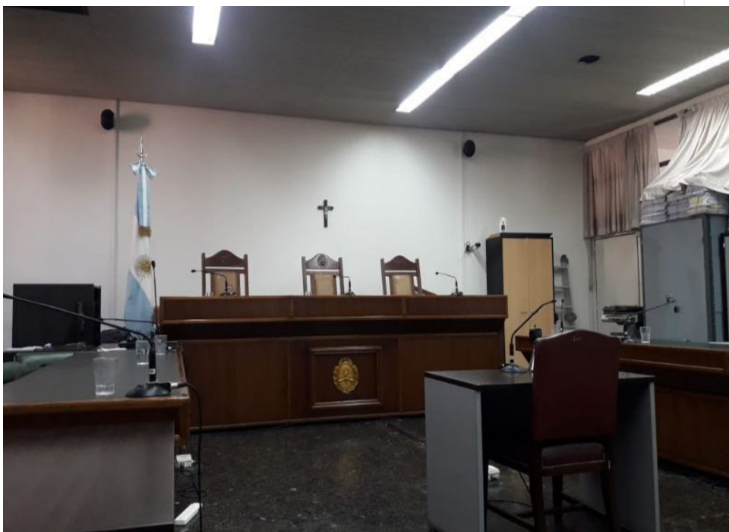
Tribunal Oral Federal de Corrientes.

Buenos Aires, 5 ago (RHC) El Tribunal Oral Federal de Corrientes, en el norte argentino, acogerá la primera jornada del juicio contra 10 exmilitares por crímenes de lesa humanidad contra más de 100