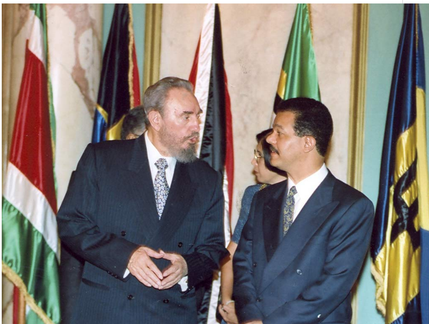
Fidel Castro y Leonel Fernández, presidente de Dominicana, 1998.