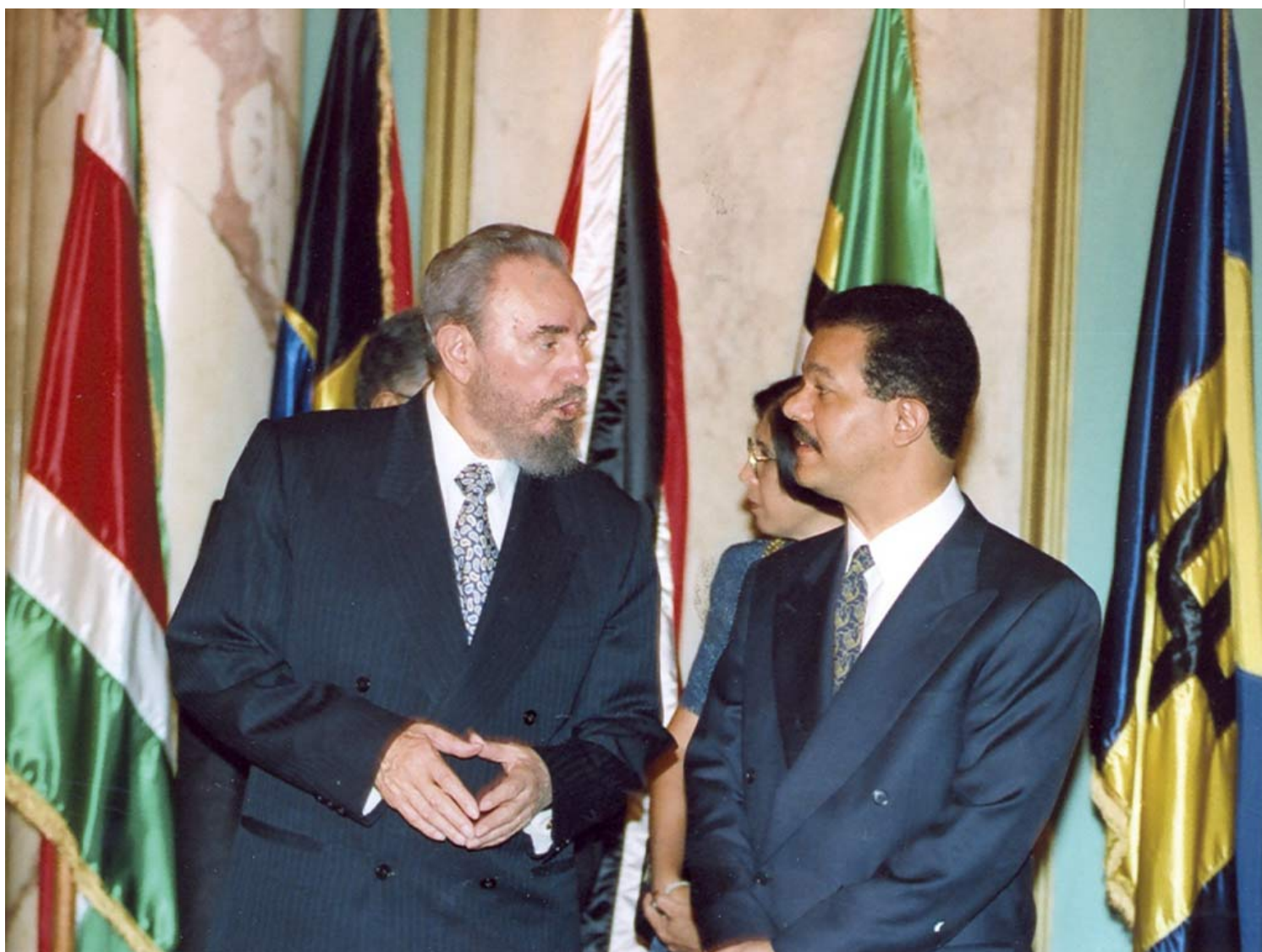
Fidel Castro y Leonel Fernández, presidente de Dominicana, 1998.