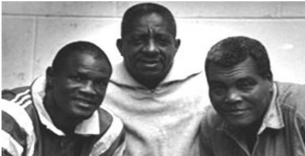
De izquierda a derecha: Savón, Sagarra y Stevenson.

Sagarra formó a varias generaciones de boxeadores reconocidos a escala global como Enrique Regüíferos (63,5 kilogramos), Rolando Garbey (71) y Roberto Caminero (60), primer campeón panamericano de Cuba en 1963.