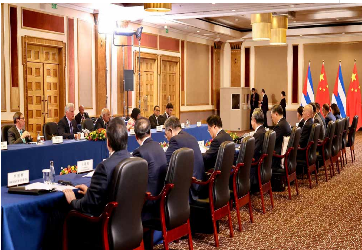
Delegaciones de Cuba y China se reúnen en el marco de la cumbre del Brics.

Johannesburgo, 23 ago (RHC) Los presidentes de Cuba, Miguel Díaz-Canel, y de China, Xi Jinping, sostuvieron un diálogo este miércoles en el contexto de la XV Cumbre Brics.