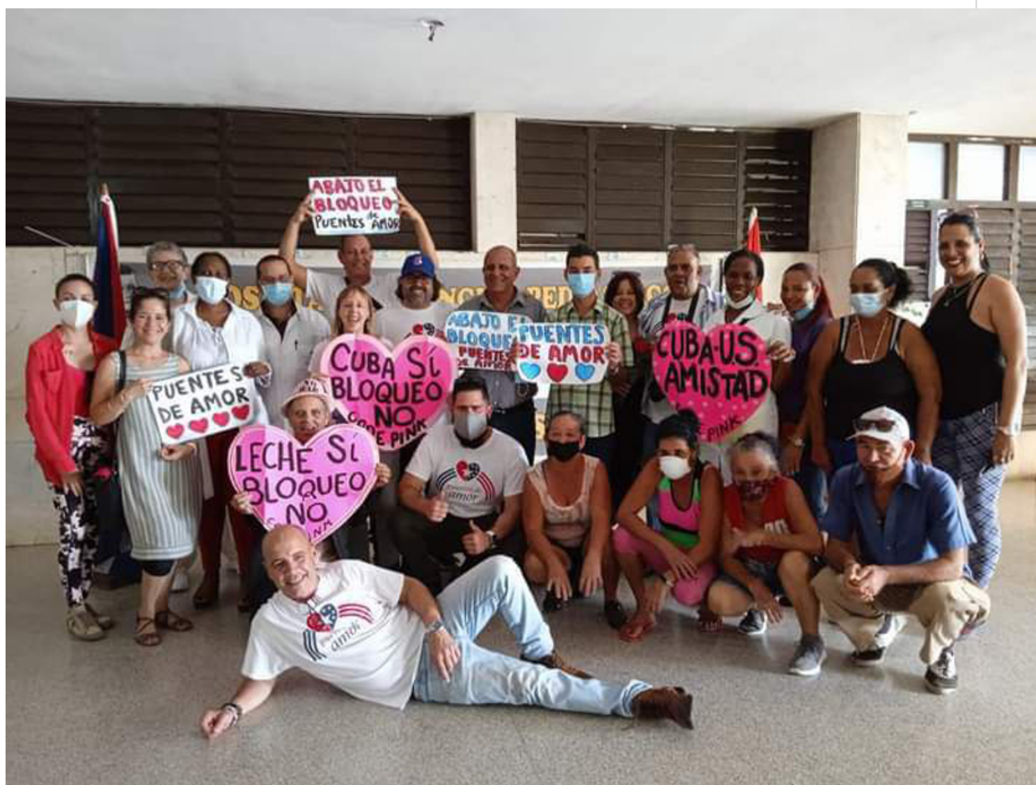
Integrantes de Puentes de Amor y Code Pink en Villa Clara.