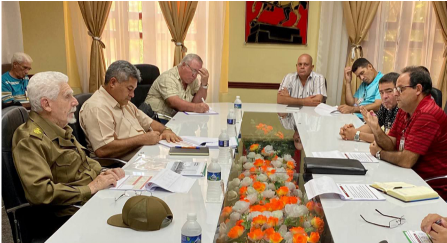
Ramiro Valdés instó a aprender de las mejores experiencias en el terreno.

Camagüey, 25 ago (RHC) El Comandante de la Revolución, Ramiro Valdés Menéndez, vice primer ministro cubano, chequea este viernes las acciones para el enfrentamiento a la minería ilegal, el desarrollo de la inversión en la fábrica de cemento 26 de Julio y el estado actual de la central termoeléctrica 10 de Octubre, ambas entidades pertenecientes al municipio de Nuevitas.