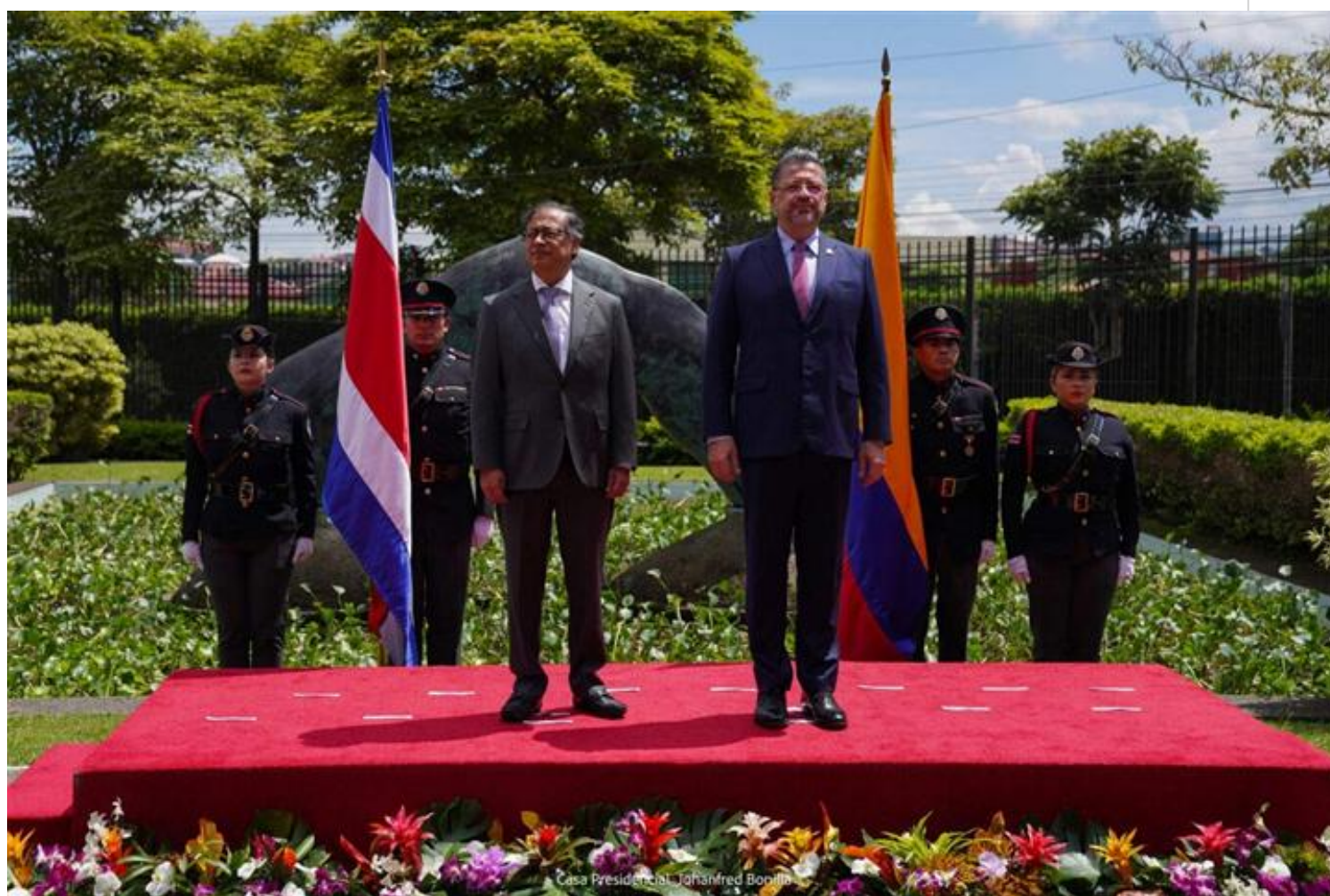
Gustavo Petro, de visita oficial en Costa Rica, junto a su homólogo Rodrigo Chaves.

San José, 28 ago (RHC) El presidente de Colombia, Gustavo Petro, explicó este lunes en Costa Rica la necesidad de construir una nueva política común en Latinoamérica para enfrentar el tema migratorio, un fenómeno que calificó de cada vez más creciente.