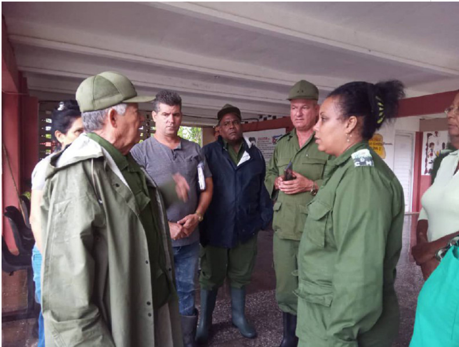
Ramón Pardo Guerra, jefe del Estado Mayor Nacional de la Defensa Civil, visita el centro de evacuación de Sandino.