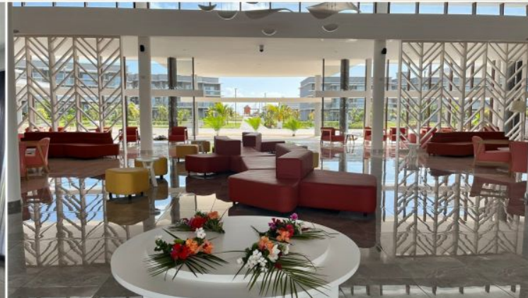
Futuro Vila Galé Cayo Paredón, que abrirá en octubre.

La Habana, 29 ago (RHC) El grupo portugués Vila Galé Hotéis desembarca en un nuevo destino, Cuba, donde en octubre abrirá Vila Galé Cayo Paredón, un resort en el cayo de igual nombre, con 638 habitaciones -18 de ellas suites-, siete restaurantes, cinco bares, piscinas, espacios para los más jóvenes, salones para eventos, centro náutico y canchas polideportivas.