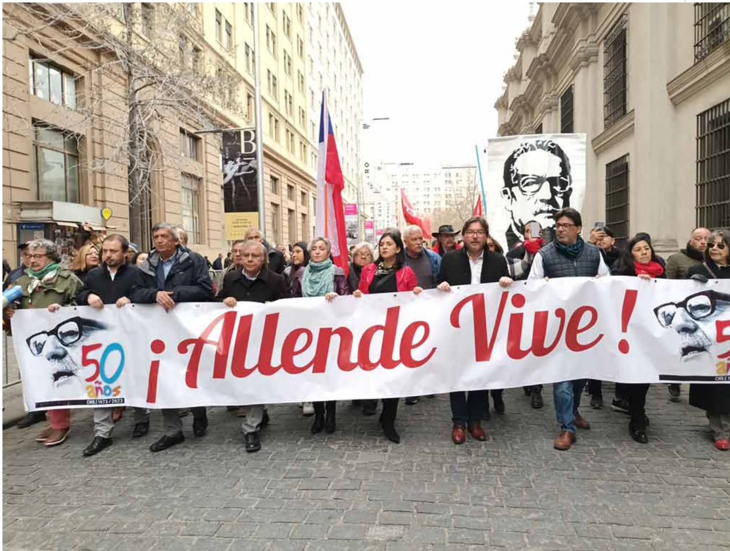
Peregrinación hasta el monumento a Salvador Allende, en la Plaza de la Constitución.