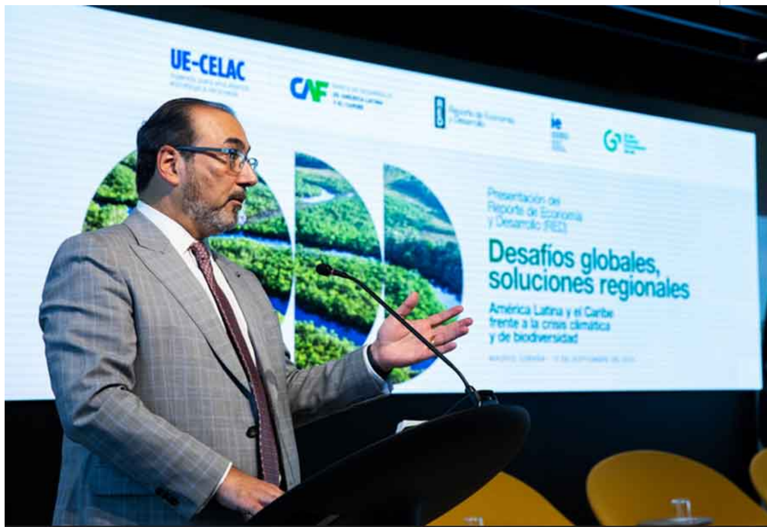
Sergio Díaz Granados

Madrid, 13 sep (RHC) Una agenda dibujada hoy por 60 países europeos y latinoamericanos, espera proyectar una hoja de ruta este viernes en Santiago de Compostela, donde dialogarán ministros de ambas regiones.