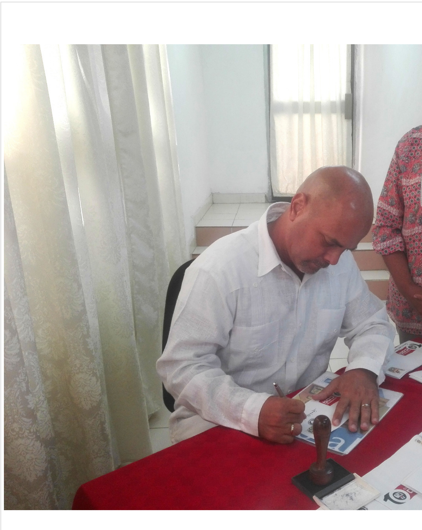
La Havane, 14 septembre (RHC) Gerardo Hernández Nordelo, Héros de la République de Cuba et Coordinateur National des Comités de Défense de la Révolution (CDR), a oblitéré de manière commémorative le timbre-poste correspondant au 40ème anniversaire de l'organisation de masse, qui a