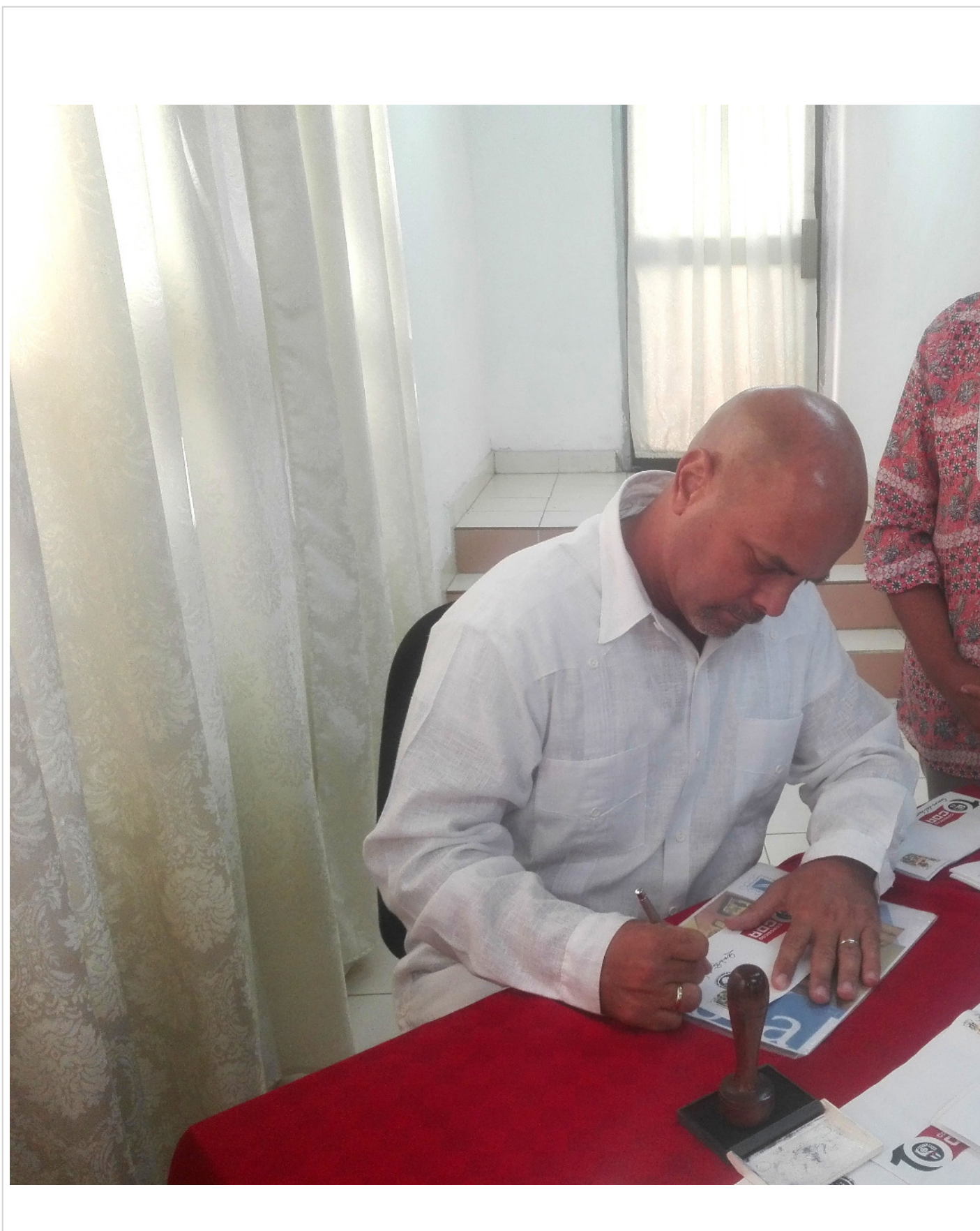
La Havane, 14 septembre (RHC) Gerardo Hernández Nordelo, Héros de la République de Cuba et Coordinateur National des Comités de Défense de la Révolution (CDR), a oblitéré de manière commémorative le timbre-poste correspondant au 40ème anniversaire de l'organisation de masse, qui a