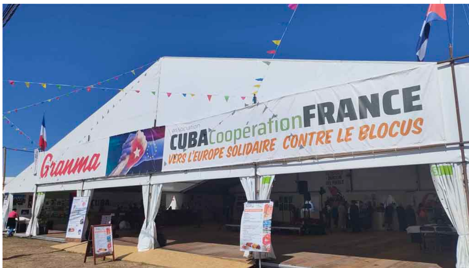
Fête de l'humanité, en París.

París, 15 sep (RHC) La solidaridad con Cuba y la condena al bloqueo que le impone Estados Unidos son protagonistas en el festival político-cultural francés la Fête de l'humanité, que comenzó este viernes en la Región Parisina.