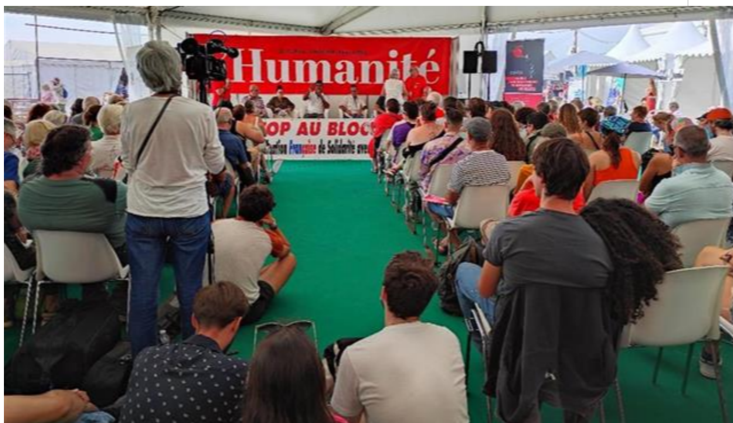
La asociación francesa Cuba Linda denuncia bloqueo a la isla.

París, 16 sep (RHC) La asociación francesa Cuba Linda organizó este sábado en la Fête de l'Humanité un debate para denunciar la inclusión de la isla en la unilateral lista de países patrocinadores del terrorismo, una medida que refuerza el bloqueo estadounidense.