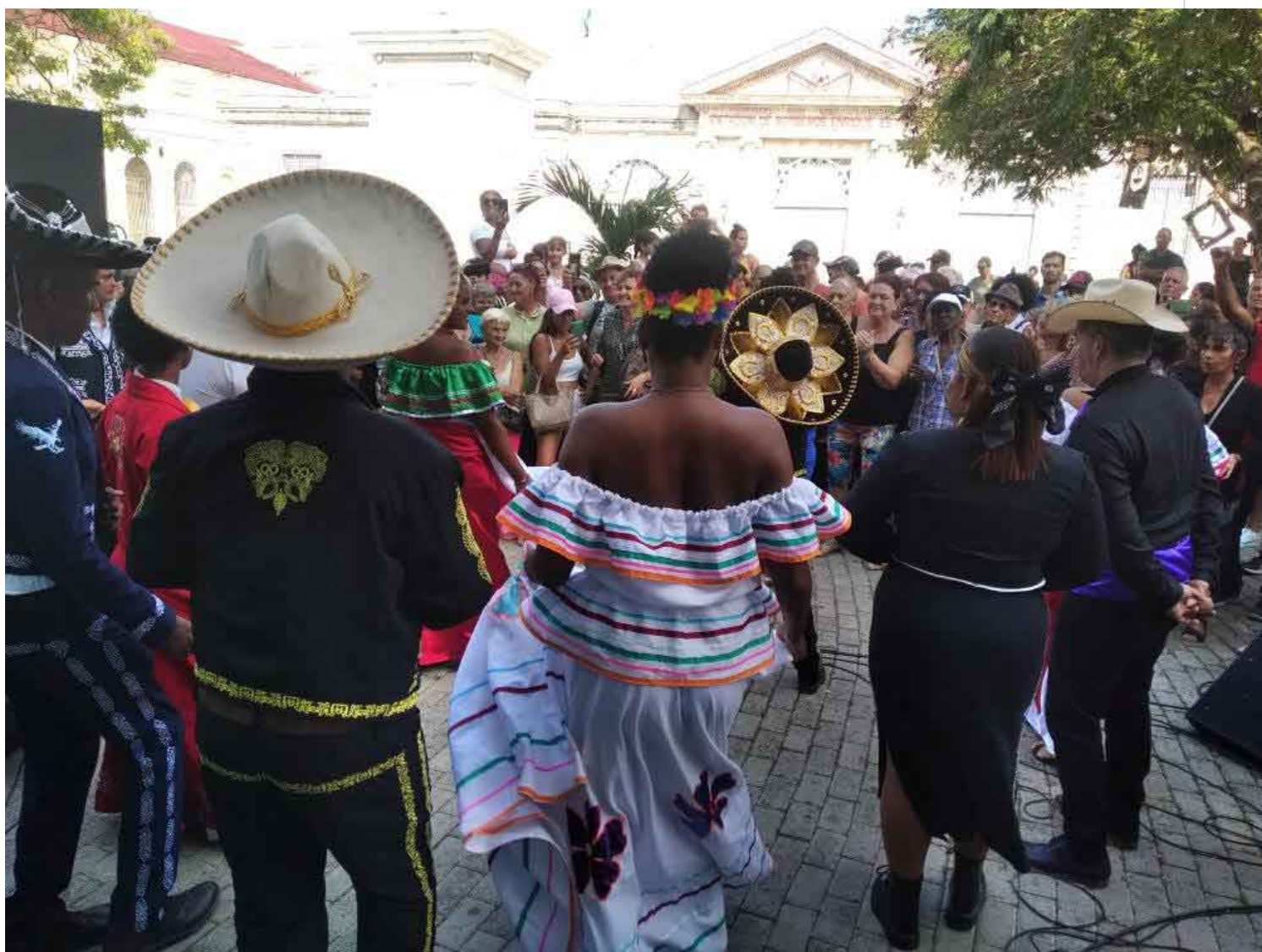
En la matancera Plaza La Vigía, homenaje al Grito de Dolores.