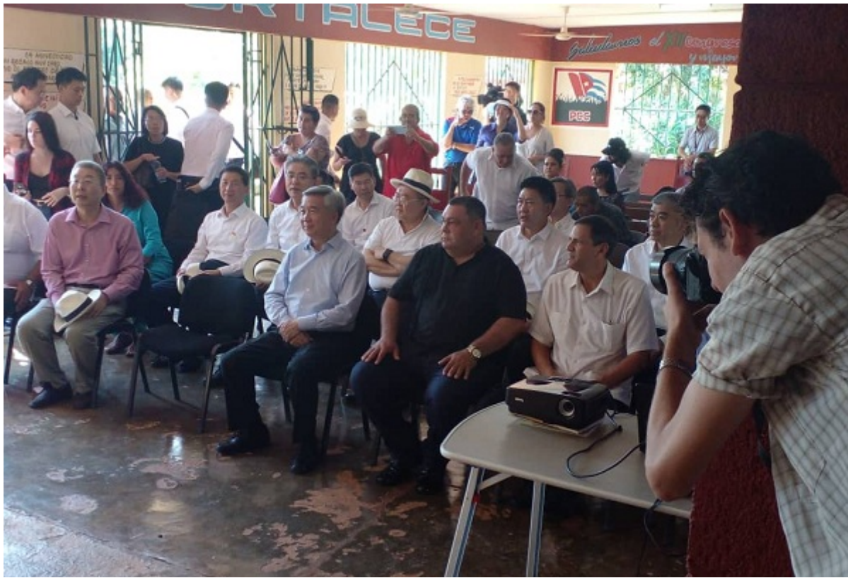
Li Xi (C) junto a dirigentes del PCC y trabajadores de la CCS 'Frank País'.