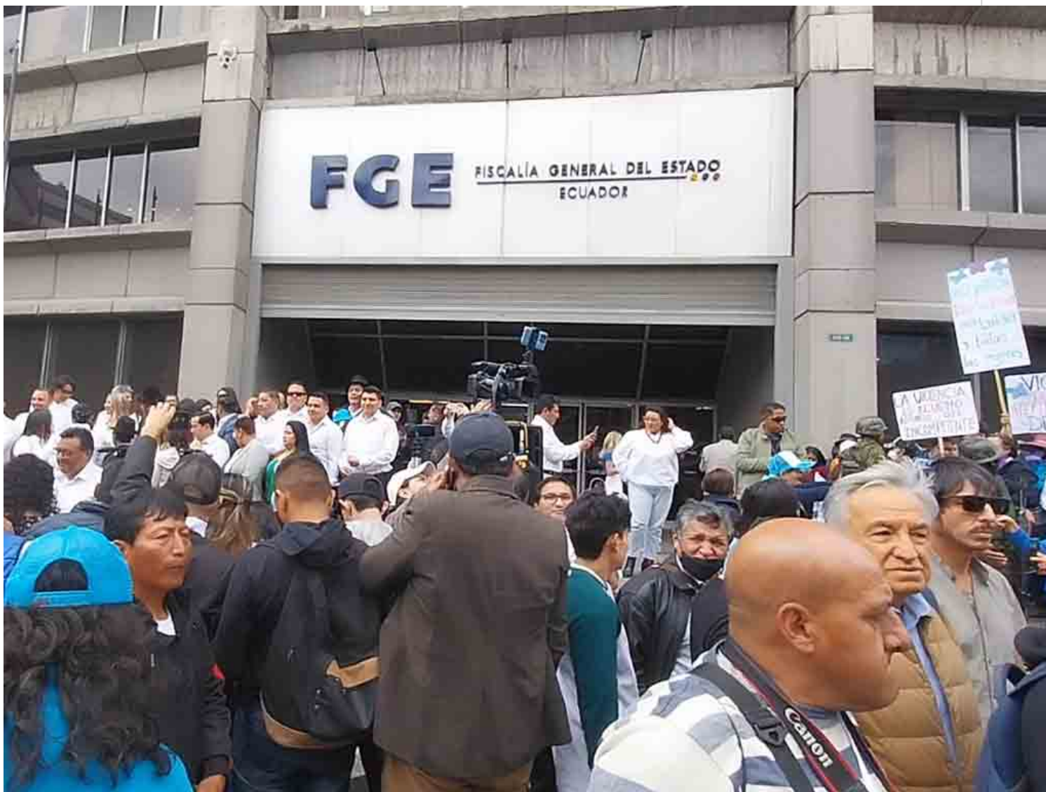
Simpatizantes de Luisa González frente a la Fiscalía General.