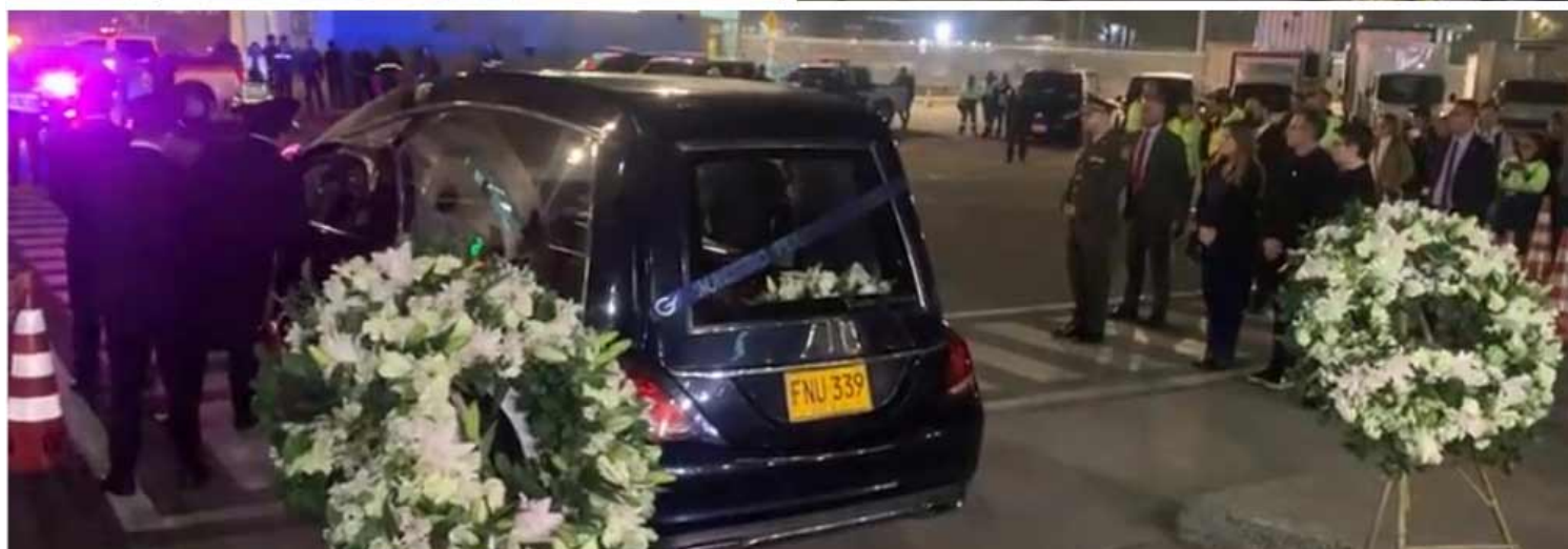
Comienza el homenaje a Fernando Botero, "el pintor de la desmesura".