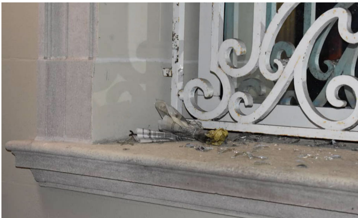
Atentado a la embajada de Cuba en EEUU.