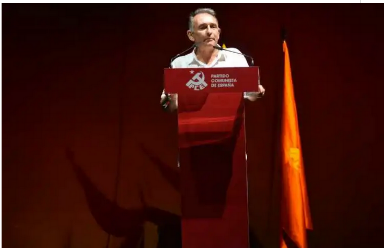
Enrique Santiago, secretario general del Partido Comunista de España.

Madrid, 2 oct (RHC) El Partido Comunista de España (PCE) reafirmó su rechazo a los bloqueos y sanciones unilaterales, a las tendencias fascistas que hoy toman fuerza en el mundo, y ratificó su apoyo a la paz y la solidaridad.