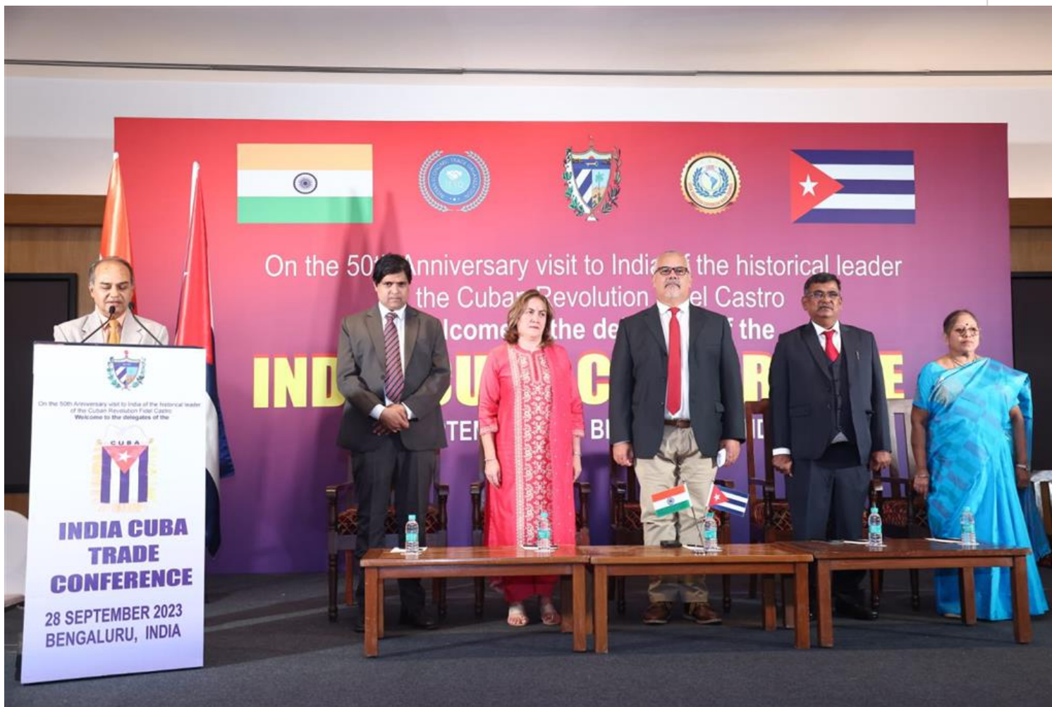
Encuentro de empresarios indios interesados en el comercio con Cuba.

Nueva Delhi, 2 oct (RHC) Empresarios de la ciudad de Bangalore analizaron posibilidades de inversión en Cuba durante un encuentro a propósito de cumplirse 50 años de la primera visita a la India de Fidel Castro, informaron este lunes fuentes diplomáticas.