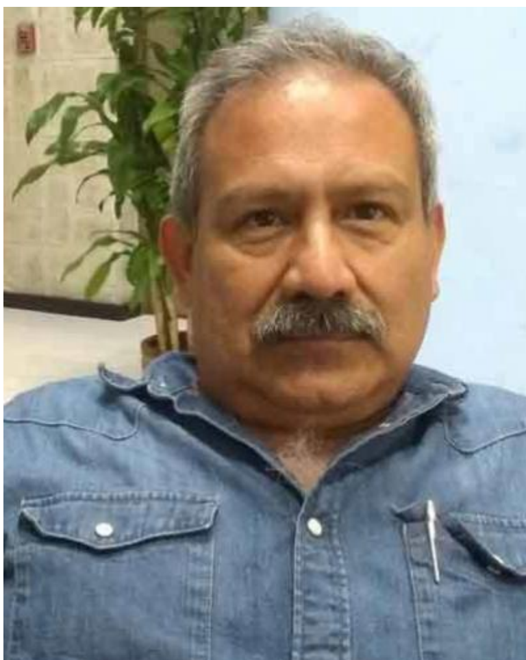
Hernando Calvo Ospina.

Roma, 9 oct (RHC) El escritor colombiano Hernando Calvo Ospina, presenta este mes en Italia su libro El Enigma de La Coubre y el documental La Fábrica del Odio, sobre acciones terroristas y la guerra mediática estadounidense contra Cuba, indica hoy un comunicado.