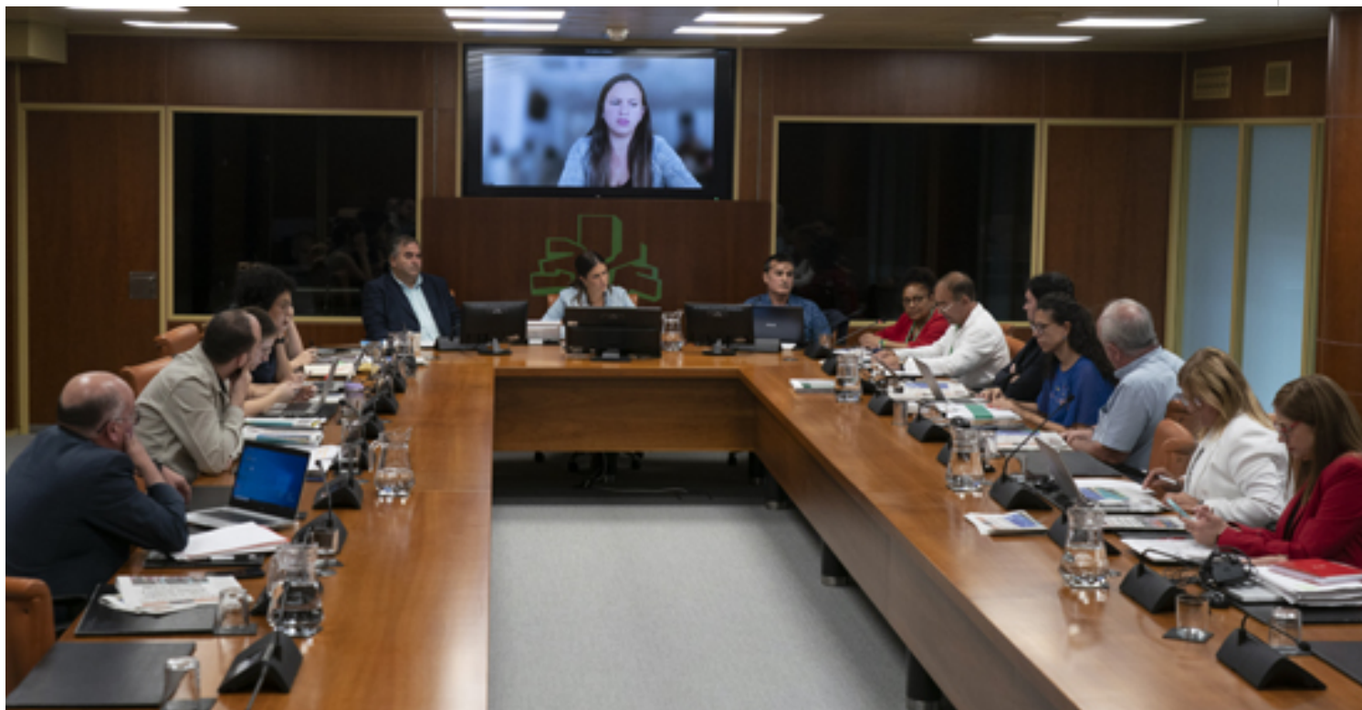
En el parlamento vasco se denuncia el bloqueo contra Cuba.

Madrid, 10 oct (RHC) Asociaciones de amistad presentaron este martes ante el Parlamento de Euskadi (País Vasco), denuncias sobre las graves consecuencias del bloqueo y hostilidad contra Cuba.