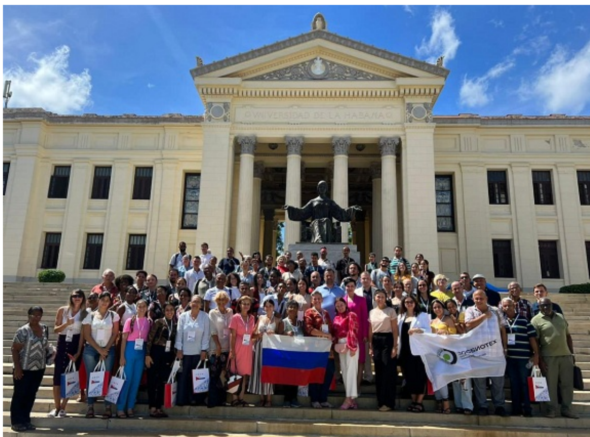
Al pie del Alma Mater, en la Universidad de La Habana, los asistentes al entrenamiento agradecen las jornadas de aprendizaje.