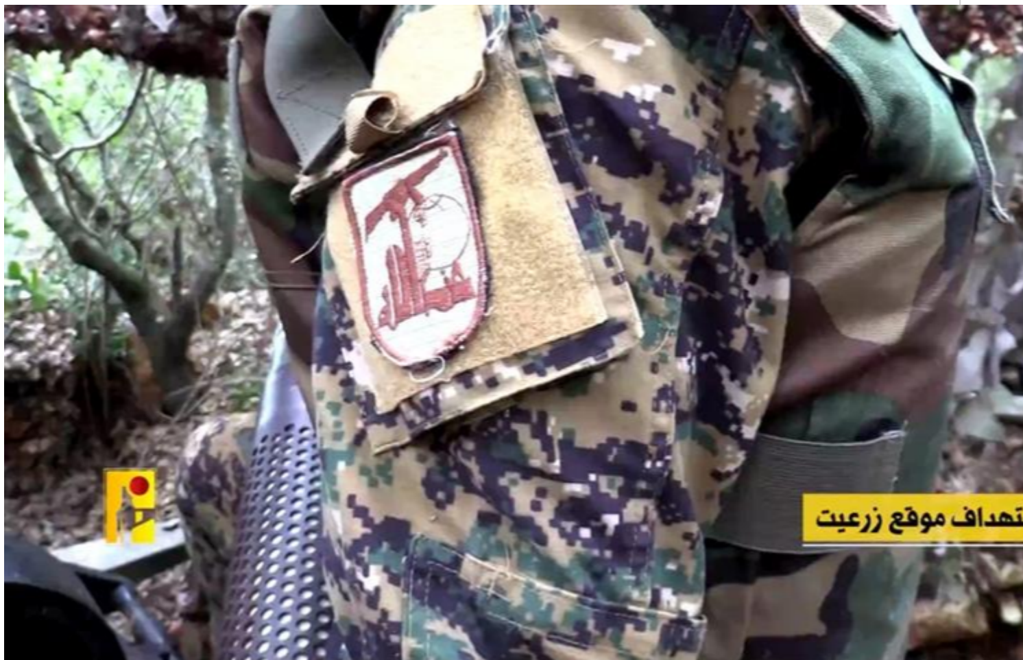
Frentes regionales activos en respaldo a Palestina.

Beirut, 21 oct (RHC) A la luz de la persistente agresión israelí a la Franja de Gaza, frentes regionales de la resistencia permanecen hoy activos en Líbano, Iraq y Yemen en respaldo a la lucha del pueblo palestino.