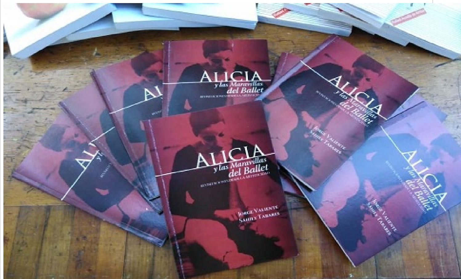
Libro Alicia las Maravillas del Ballet

La Habana, 22 oct (RHC) El libro "Alicia y las Maravillas del Ballet. Revisitaciones desde la artísticidad", del fotógrafo Jorge Valiente y la periodista Sahily Tabares, será presentado el próximo martes en la capitalina librería Fayad Jamís, informó hoy la institución.