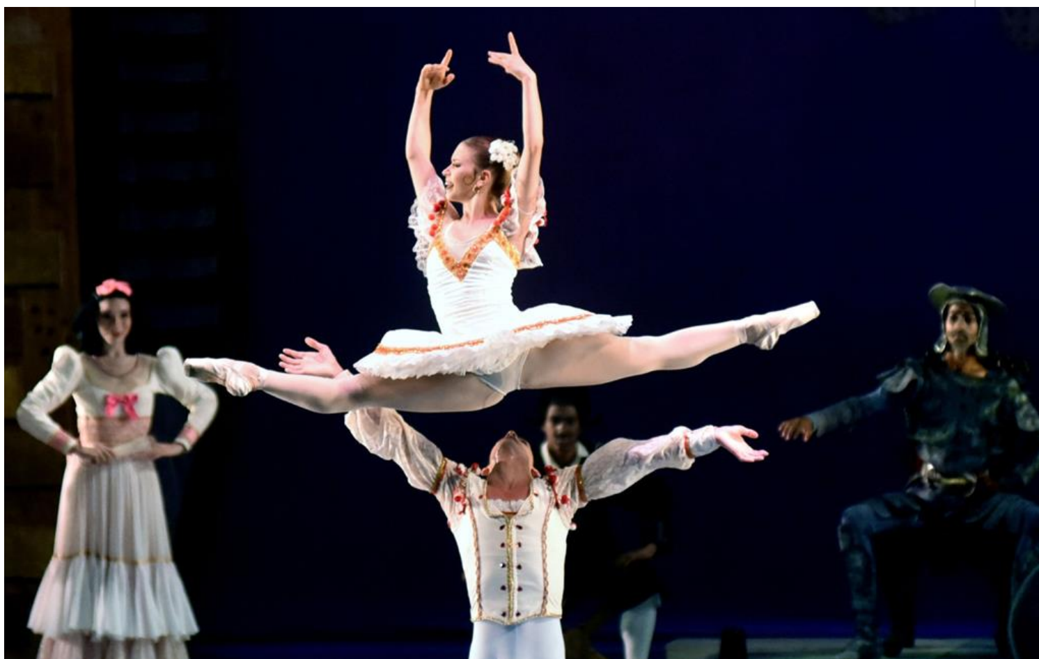
Ballet Nacional de Cuba

La Habana, 23 oct (RHC) En la sala Avellaneda del Teatro Nacional de Cuba continúa este lunes el homenaje a la prima ballerina absoluta Alicia Alonso (1920-2019).