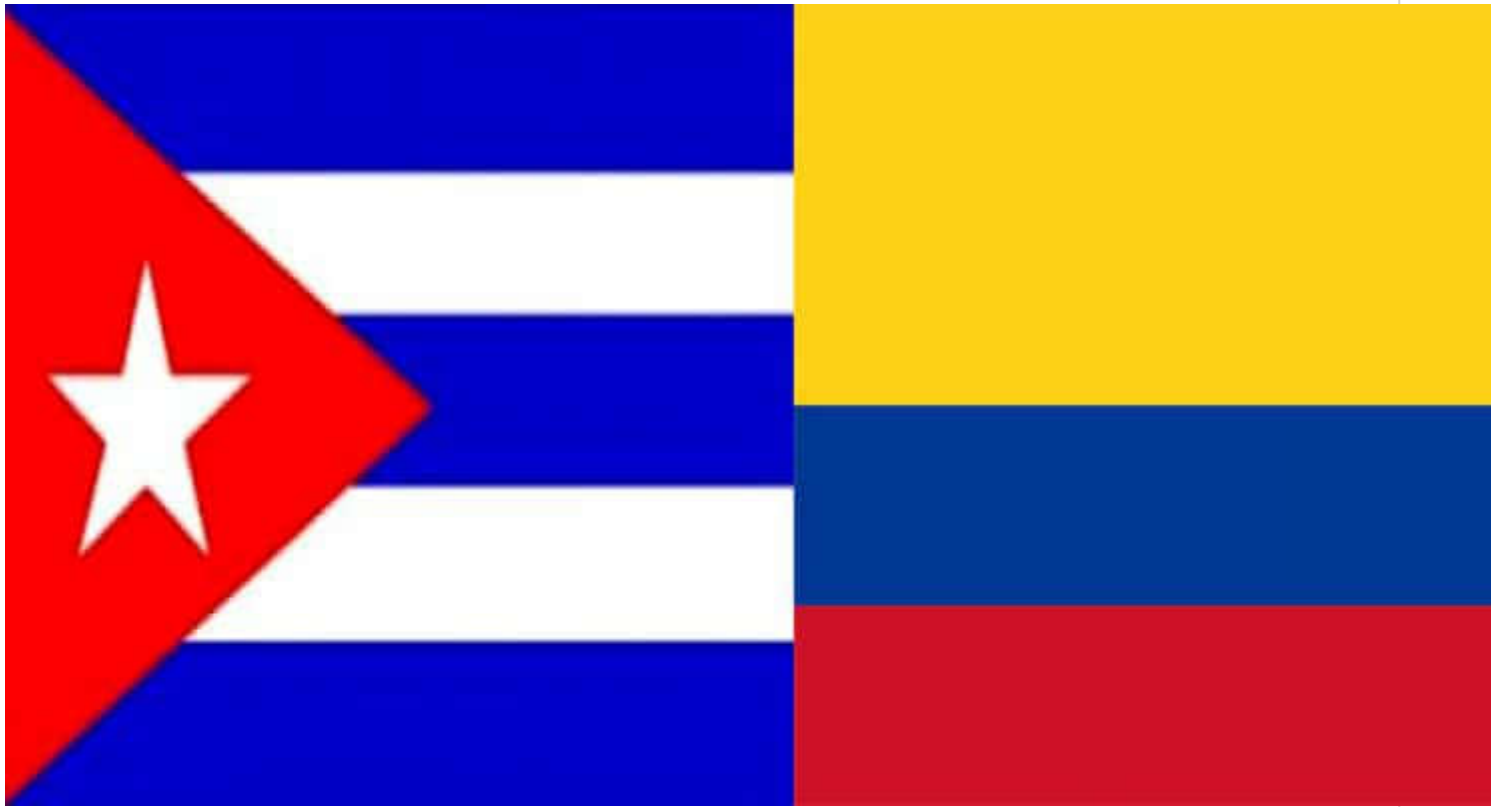
Drapeaux cubain et colombien

En ce sens, les signataires soulignent qu'ils ne peuvent rester indifférents "face aux agressions subies, d'autant plus lorsque le respect de leurs engagements en faveur de la paix est utilisé comme prétexte".