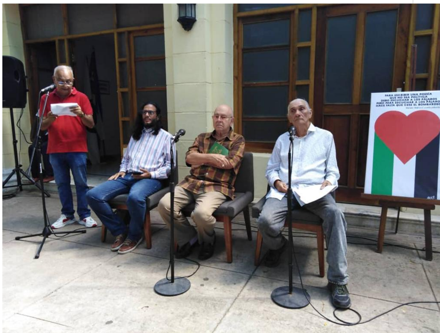
Intelectuales cubanos alzan su voz contra genocidio israelí contra el pueblo palestino.