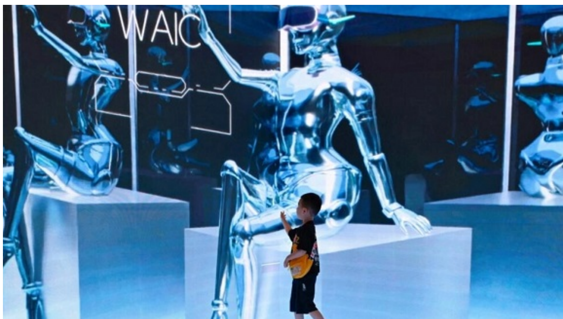
Un niño visita la Conferencia Mundial de Inteligencia Artificial, en Shanghái, el 6 de julio de 2023

La actual revolución tecnológica levanta pasiones, pero también temores, que dominarán los dos días de esta reunión celebrada en Bletchley Park (centro), donde se encuentra la emblemática sede en la que descifraban las comunicaciones durante la Segunda Guerra Mundial.