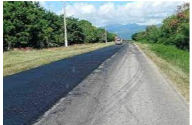
Pavimentación del pedraplén

Meliá cuenta con unos 40 hoteles en Cuba, localizados en los cayos Coco, Guillermo, Largo, y Santa María, y en las provincias de Holguín, La Habana, Santiago de Cuba, Camagüey, Cienfuegos y el balneario de Varadero, en Matanzas. (Tomado de PL)