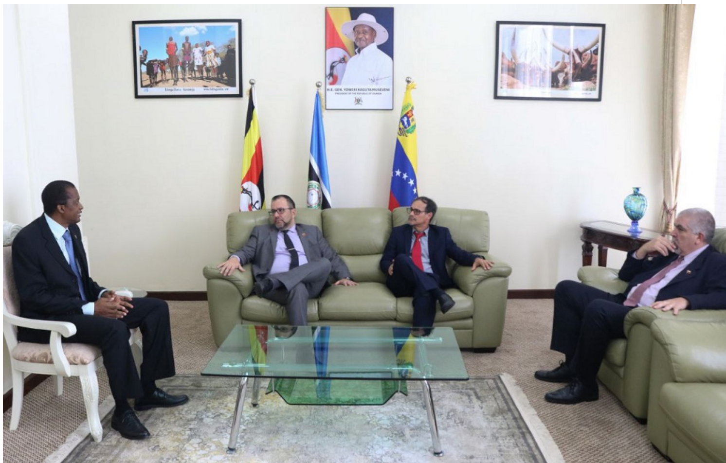
Ivan Gil en Uganda.

Kampala, 2 nov (RHC) El ministro para Relaciones Exteriores de Venezuela, Yván Gil, arribó este jueves a Uganda como parte de su gira por África, que incluyó ya la República del Congo, Etiopía y Ruanda.