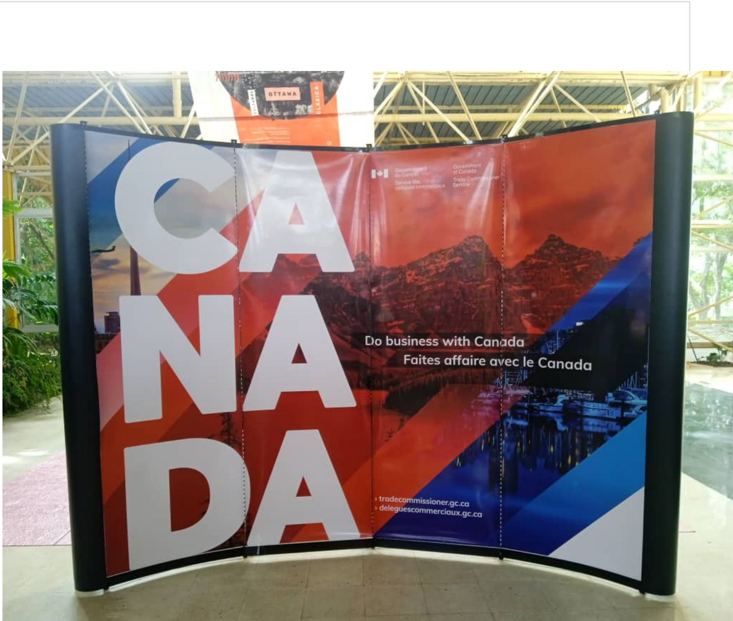
Stand de Canadá en Fihav-2023.