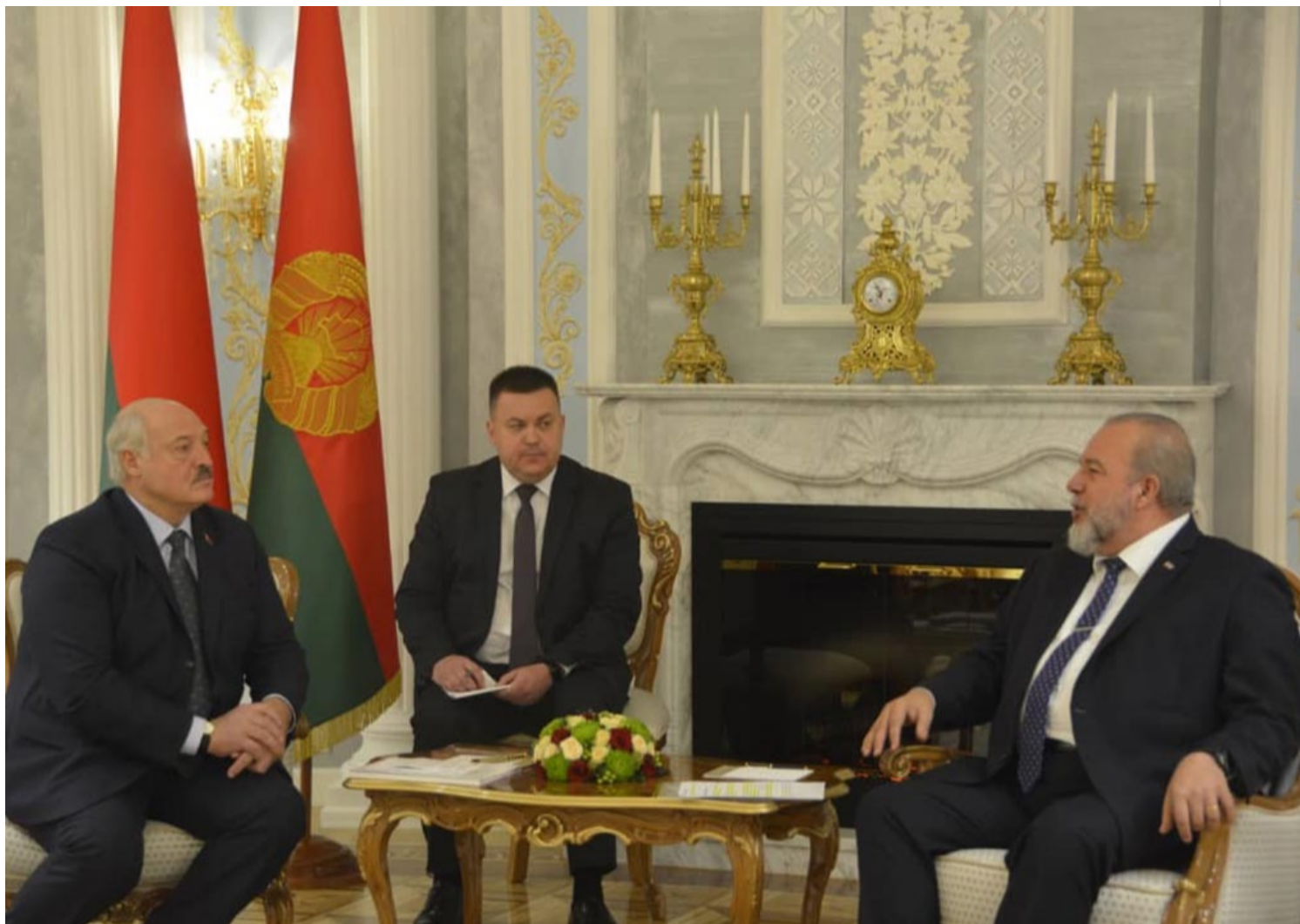
Presidente de Belarús, Aleksander Lukashenko (I), y el primer ministro cubano, Manuel Marrero.

Minsk, 10 nov (RHC) Las relaciones económicas entre Belarús y Cuba deben alcanzar el nivel de las políticas, declaró este viernes el presidente de la nación eslava, Aleksander Lukashenko, al recibir al primer ministro cubano, Manuel Marrero.