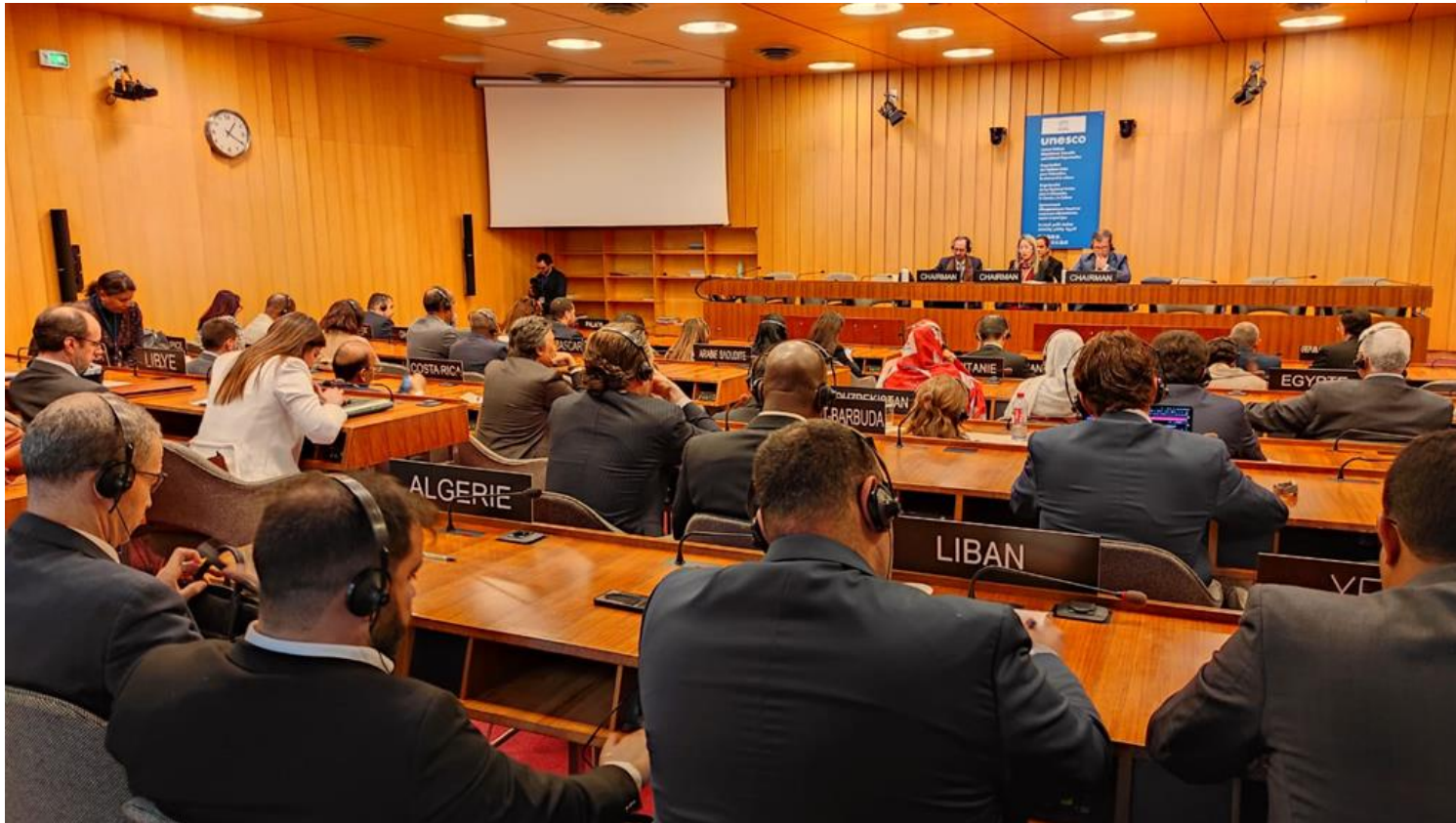
Naima Ariatne Trujillo en reunión ministerial del Grupo de los 77 más China y del Movimiento de Países No Alineados, en el marco de la 42 Conferencia General de la Unesco.

París, 10 nov (RHC) Cuba reiteró en la Unesco su visión desde la Presidencia pro tempore del Grupo de los 77 y China de la importancia de la unidad y la cooperación entre los países del Sur.