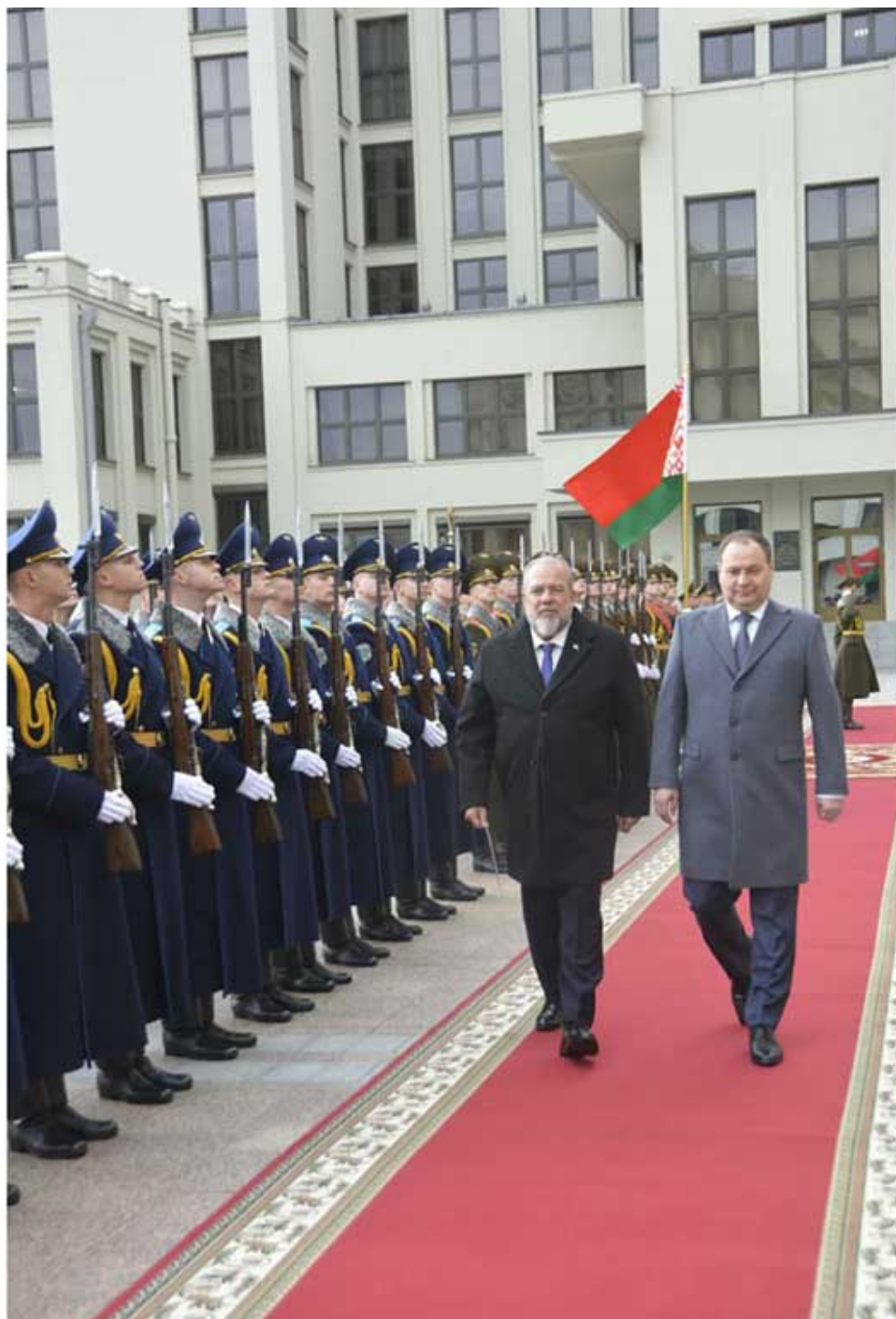
Román Golóvchenko (I) y Manuel Marrero, durante el recibimiento oficial.

Minsk 10 nov (RHC) Belarús y Cuba enfrentan conjuntamente el dictado de sanciones, manifestó este viernes el primer ministro belaruso, Román Golóvchenko, durante conversaciones oficiales con su homólogo de Cuba, Manuel Marrero.