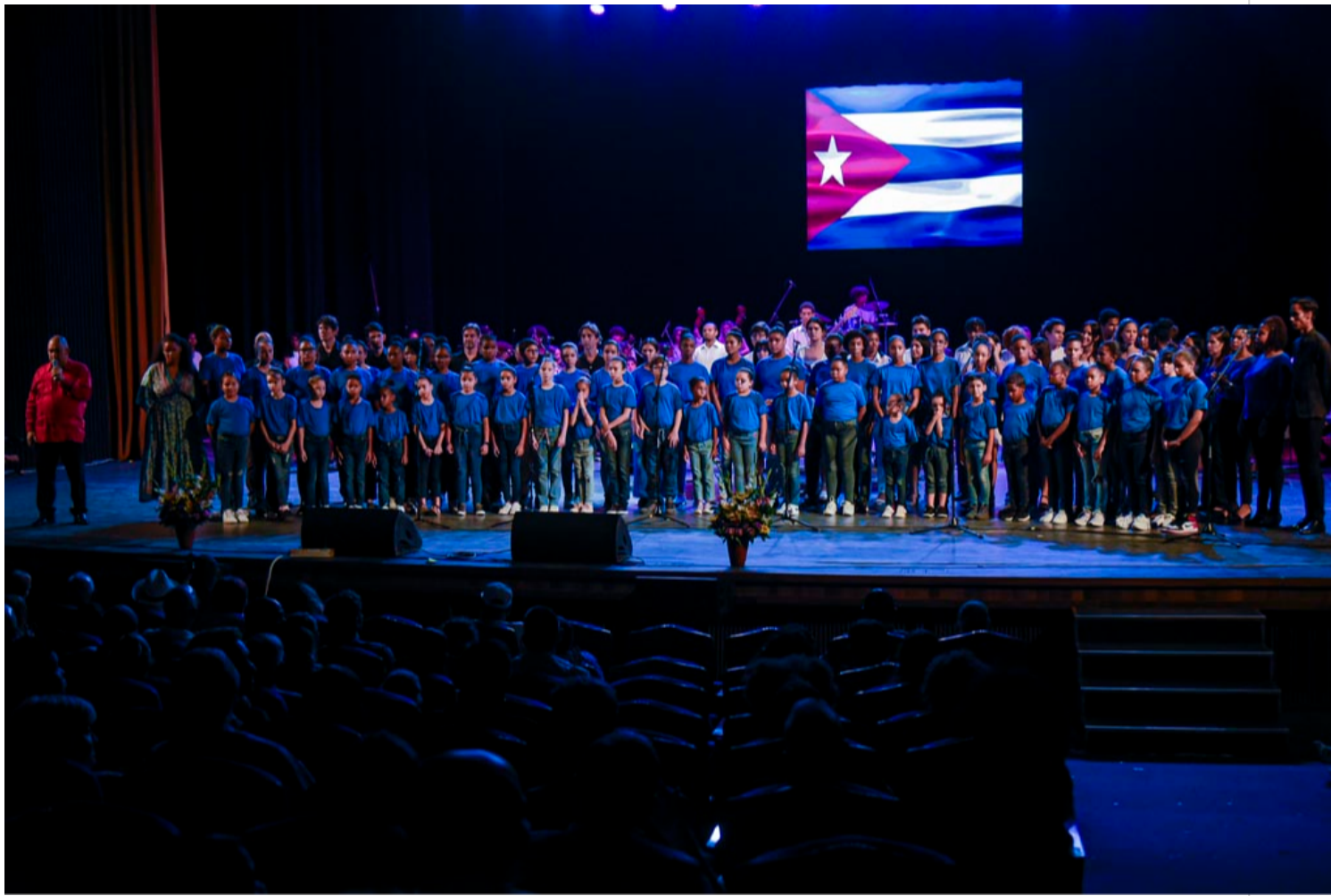
Clausura del Festival de Cubanos Residentes en el Exterior.

La Habana, 13 nov (RHC) Con un concierto del pianista Nachito Herrera, en el Teatro Nacional de Cuba, concluyó el Festival de Cubanos Residentes en el Exterior, muestra hoy del acercamiento entre instituciones de la isla y artistas establecidos fuera de ella.