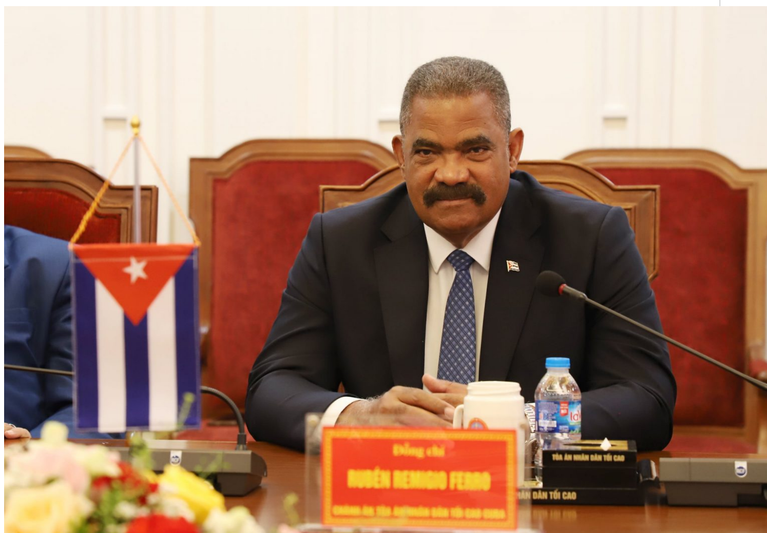
Rubén Remigio Ferro.

Hanoi, 13 nov (RHC) El presidente del Tribunal Supremo Popular (TSP) de Cuba, Rubén Remigio Ferro, encomió este lunes el dinámico intercambio existente con su par vietnamita, al cual agradeció su apoyo y cooperación en el ámbito tecnológico.