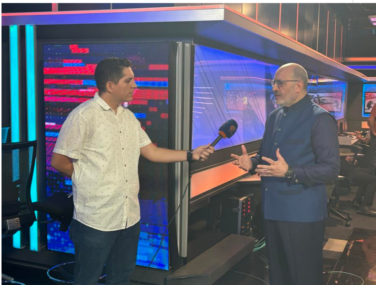
Declaraciones del presidente del Consejo de Dirección de la red panárabe, Ghassan Ben Jeddou.