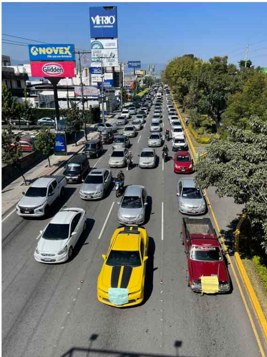
Autoridades indígenas de Sololá convocaron la caravana.

Ciudad de Guatemala, 21 nov (RHC) Caravanistas de diferentes departamentos de Guatemala llegaron este martes a la capitalina sede del Ministerio Público (MP) para exigir respeto al orden democrático ante las continuas maniobras contra las pasadas elecciones.