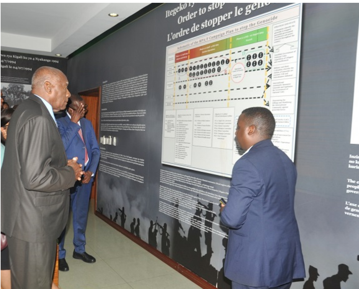
Visita al Museo de la campaña contra el genocidio, que muestra importantes páginas de la historia de Ruanda.