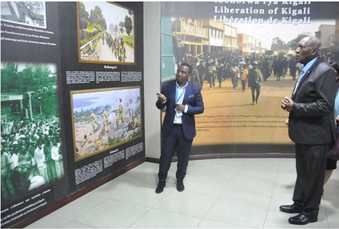
Visita al Museo de la campaña contra el genocidio, que muestra importantes páginas de la historia de Ruanda.