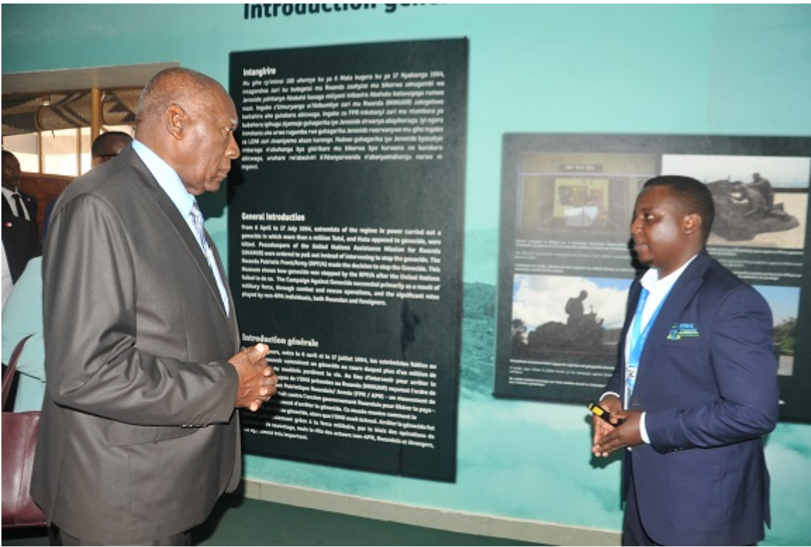
Visita al Museo de la campaña contra el genocidio, que muestra importantes páginas de la historia de Ruanda.

En las múltiples salas se explica cómo las fuerzas del Frente Patriótico Ruandés enfrentaron esa barbarie en 1994. Los detalles en ellas recogidos ayudan a comprender mejor la historia del genocidio que tuvo que enfrentar el pueblo ruandés en apenas 100 días, periodo en el que fueron asesinados más de un millón de personas.